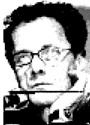
L'ATTORE Mohammad Bakri, 55 anni, attore e regista (era il protagonista del film "Private" di Costanzo) dal 26 in un monologo